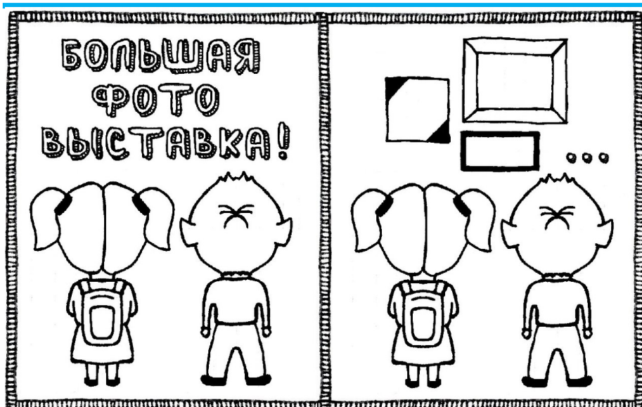
В двух словах о «Рассказе глазами»