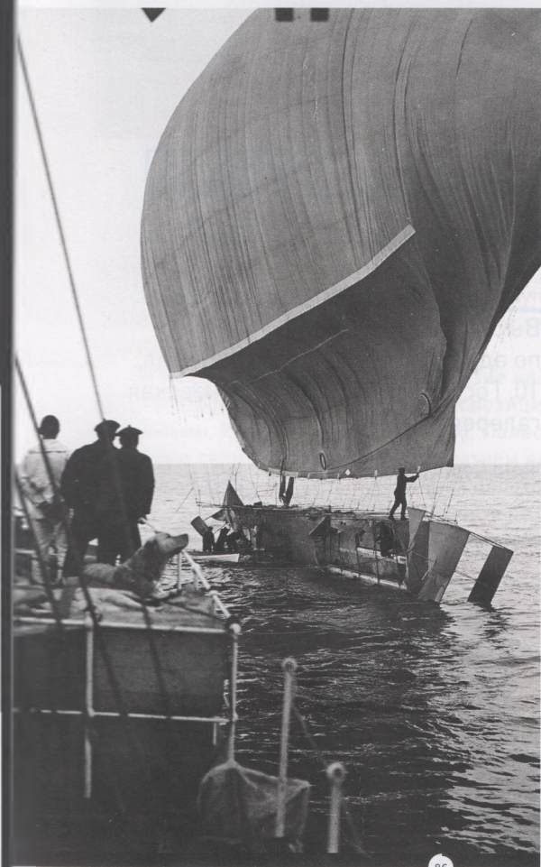
ДАТСКИЙ НАЦИОНАЛЬНЫЙ МУЗЕЙ