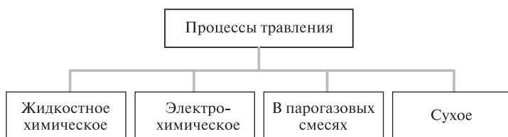
Рис. 1.1. Обобщенная классификация процессов травления

Травление — это процесс удаления вещества с поверхности твердых тел. Удаление может быть осуществлено в результате химического взаимодействия жидкого или газообразного травителя с поверхностью твердого тела, например полупроводниковой пластины (подложки) при изготовлении микросхем. В общем случае травителем (активной средой) может быть жидкость, парогазовая смесь или плазма тлеющего разряда. Травитель является источником частиц, которые удаляют материал с поверхности и определяют характер травления. Типы процессов травления представлены на рис. 1.1.