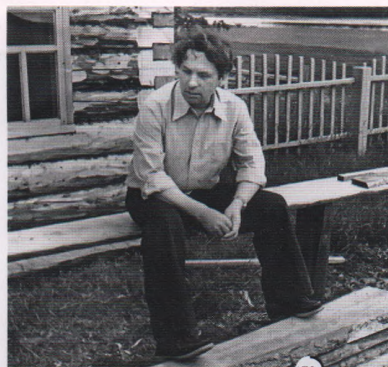
АРХАНГЕЛЬСКИЙ КРАЕВЕДЧЕСКИЙ МУЗЕЙ