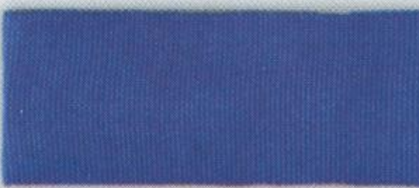
Немецких заслуженных на