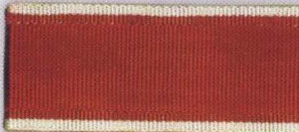
Св. Екатерины (Екатерининская)