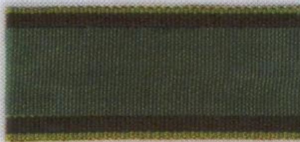
За труды по сельскому хозяйству