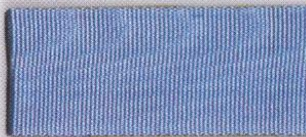
Св. Андрея Первозванного (Андреевская)