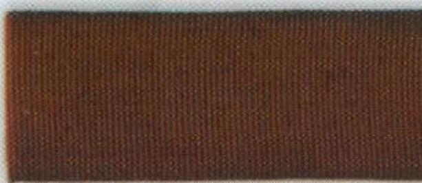
Креста Королевы Виктории