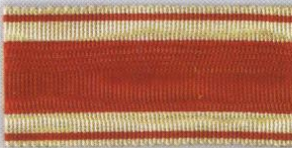
Св. Станислава (Станиславская)