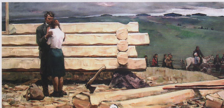
Р. ЕРМОЛИН. 22 ИЮНЯ 1941 ГОДА. 1971.