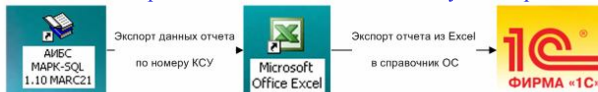
Схема экспорта данных из библиотеки в бухгалтерию