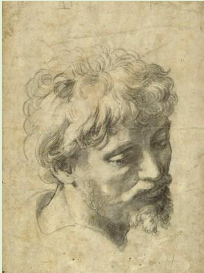
Рафаэль. Голова молодого апостола. Ок.1516 г.

Живопись Рафаэля Санти является не единственным видом изобразительного искусства, в котором художник достиг совершенства. Совсем недавно один из его рисунков («Голова молодого пророка») был продан на аукционе за 29 миллионов фунтов, став самым дорогим рисунком за всю историю искусства.