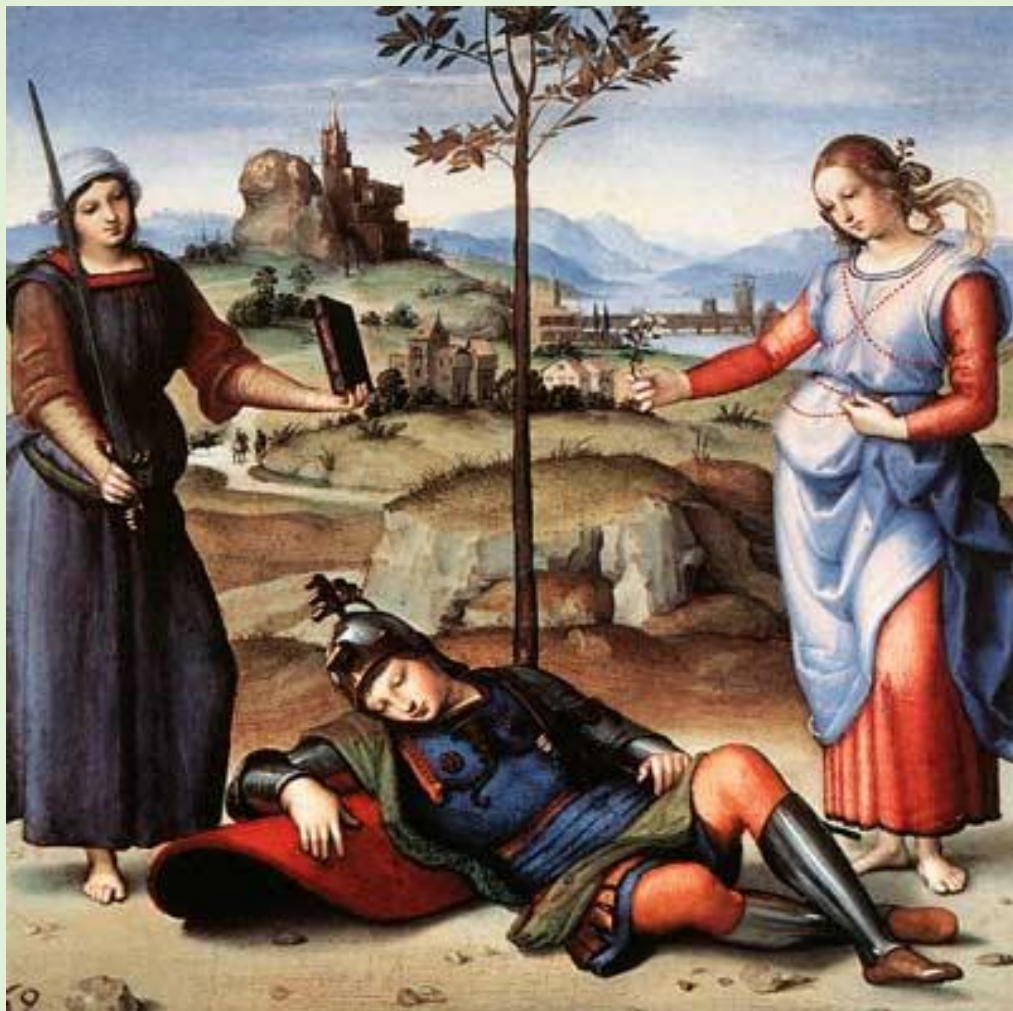
Рафаэль. Аллегория (Сон рыцаря). Ок. 1504

Переход от влияния Перуджианской школы к более динамичному и индивидуальному стилю заметен в одной из первых работ флорентийского периода – «Три грации». Рафаэль Санти сумел ассимилировать новые тенденции, при этом оставаясь верным своему индивидуальному стилю. Изменилась и монументальная живопись, о чем свидетельствуют фрески 1505 года. В настенной росписи прослеживается влияние Фра Бартоломео.