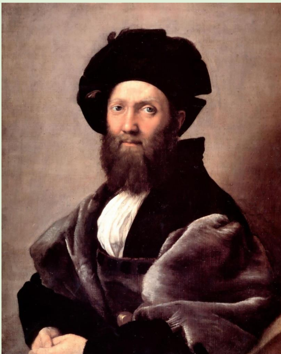
Рафаэль. Портрет Бальдассаре Кастильоне. 1503

Еще один влиятельный портрет в исполнении Рафаэля – «Портрет Бальдассаре Кастильоне», который в свое время копировали Рубенс и Рембрандт. Работа считается одной из самых известных произведений Рафаэля, а также прекрасным образцом портретного искусства. Сам Бальдассаре был поражен сверхъестественным реализмом, натурализмом и созданным эффектом человеческого присутствия.