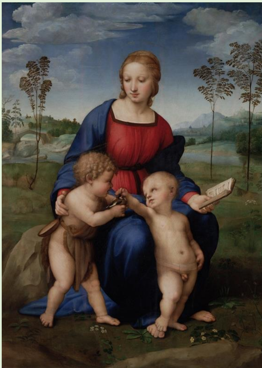
Рафаэль. Мадонна с щеглёнком. 1506

Флорентийские мадонны – созданные под влиянием Леонардо да Винчи полотна, изображающие молодую Марию с младенцем. Часто рядом с Мадонной и Иисусом изображен Иоанн Креститель. Флорентийские мадонны характеризуются спокойствием и материнской прелестью, Рафаэль не использует темных тонов и драматичных пейзажей, поэтому главным фокусом его картин являются прекрасные, скромные и любящие матери, изображенные на них, а также совершенство форм и гармония линий.