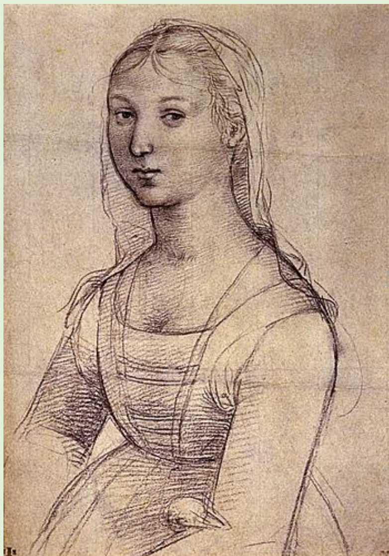
Рафаэль. Портрет девушки. 1504

его жизнь. Рафаэль Санти, несмотря на то что его творчество было временно накрыто волной маньеризма, а затем барокко, остается одним из самых влиятельных художников в истории мирового искусства.