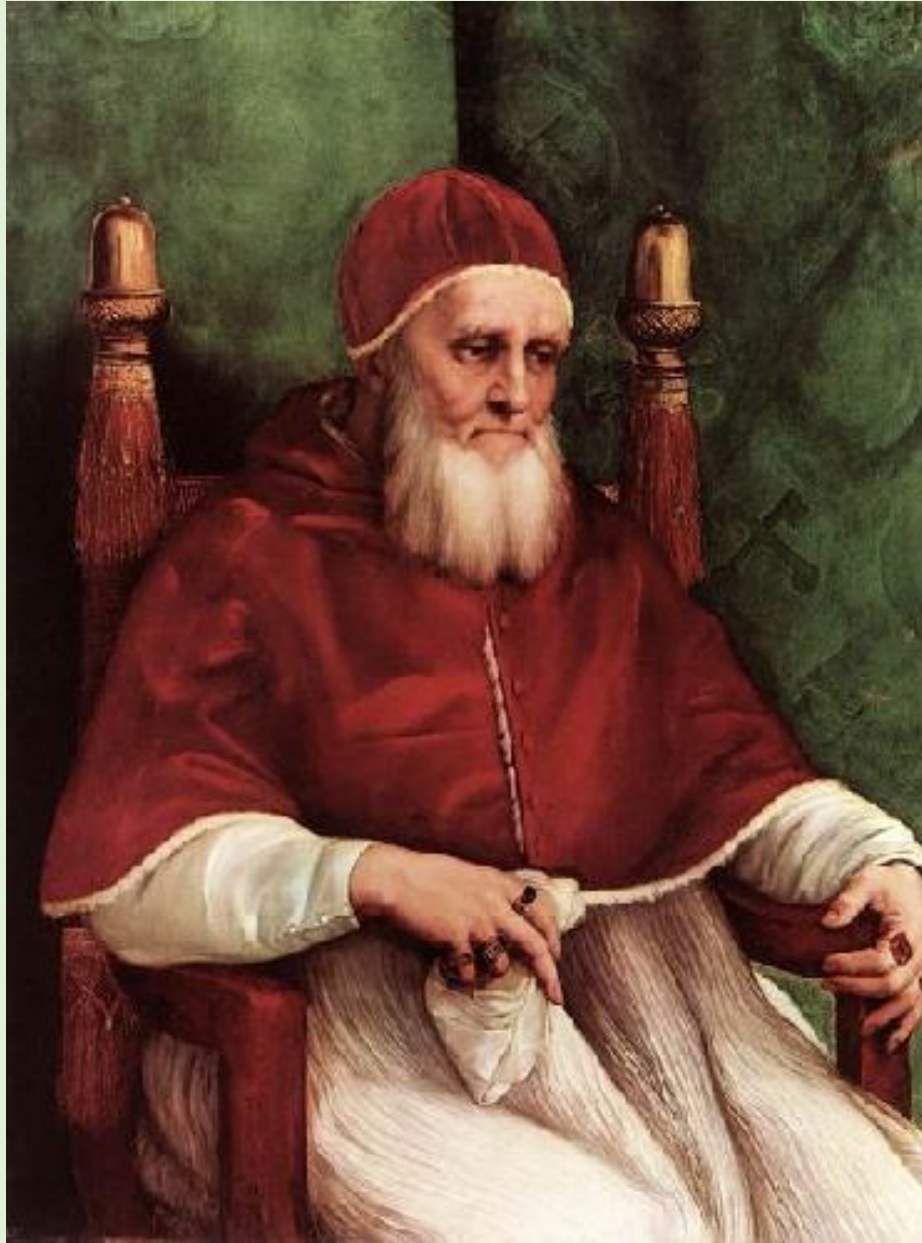
Рафаэль. Портрет папы Юлия II. 1511-1512

Портретный жанр в творчестве Рафаэля занимает не такую видную роль, как религиозная и даже мифологическая или историческая живопись. Ранние портреты художника технически отстают от остальных его полотен, однако последующее развитие техники и изучение человеческих форм позволило Рафаэлю создавать реалистичные портреты, проникнутые свойственной художнику безмятежностью и ясностью.