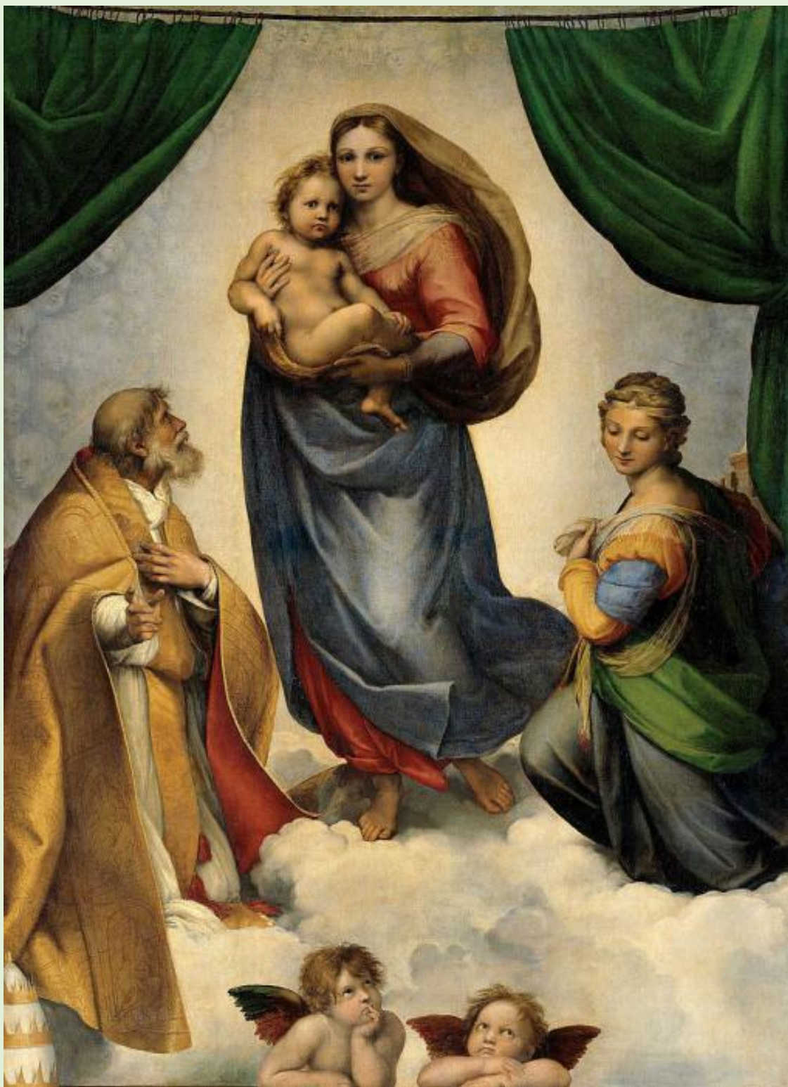
Рафаэль. Сикстинская мадонна. 1513-1514

Римские мадонны – картины, на которых кроме индивидуального стиля и техники Рафаэля не прослеживается больше никакого влияния. Еще одним отличием римских полотен является композиция. В то время как Флорентийские мадонны изображены на три четверти, римские чаще написаны во весь рост. Основным произведением этой серии является великолепная «Сикстинская Мадонна», которую называют «совершенством» и сравнивают с музыкальной симфонией.