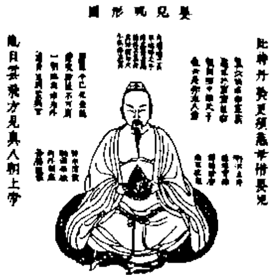
Медитация 2 степени новое рождение в пространстве силы