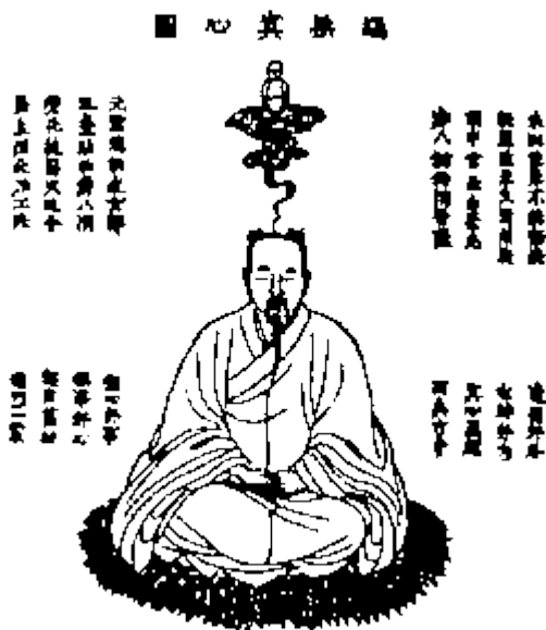
Медитация 3 степени отвязывание духовного тела и получение им самостоятельного существования