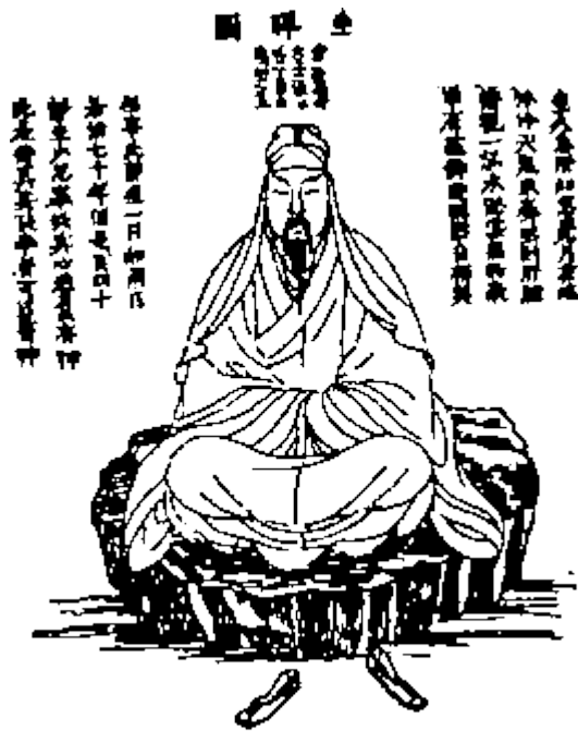
Медитация 1 степени собрание света